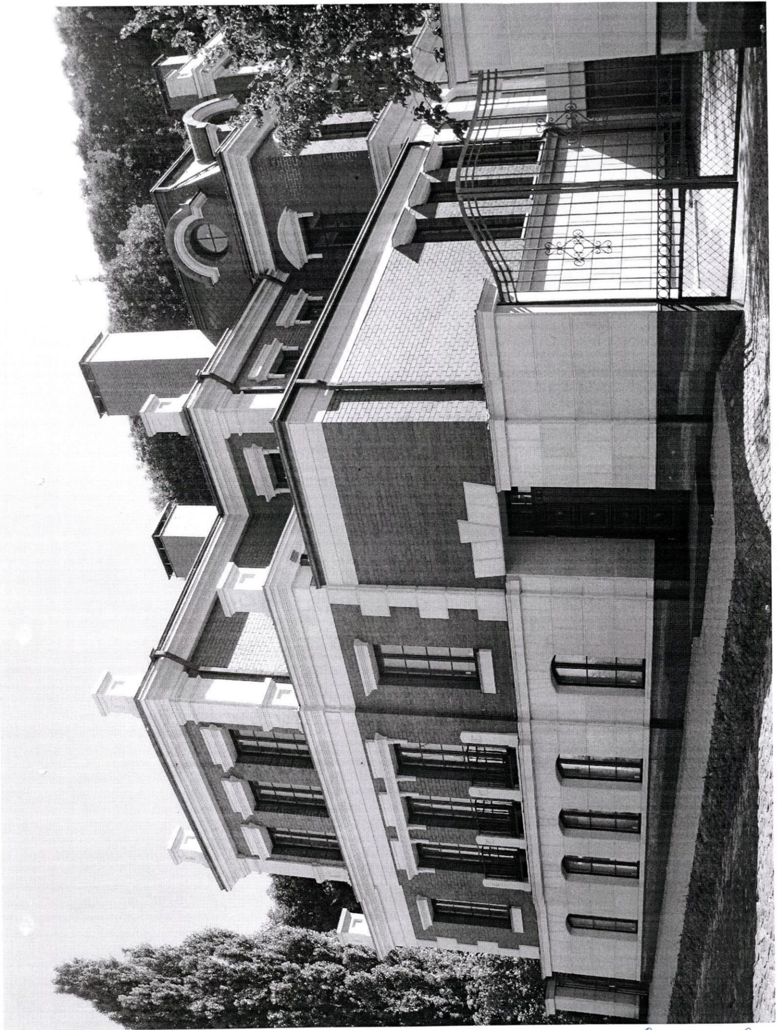
Вул. Ботунів Тік, 23-а Сучасний виступ Фото 2009р.