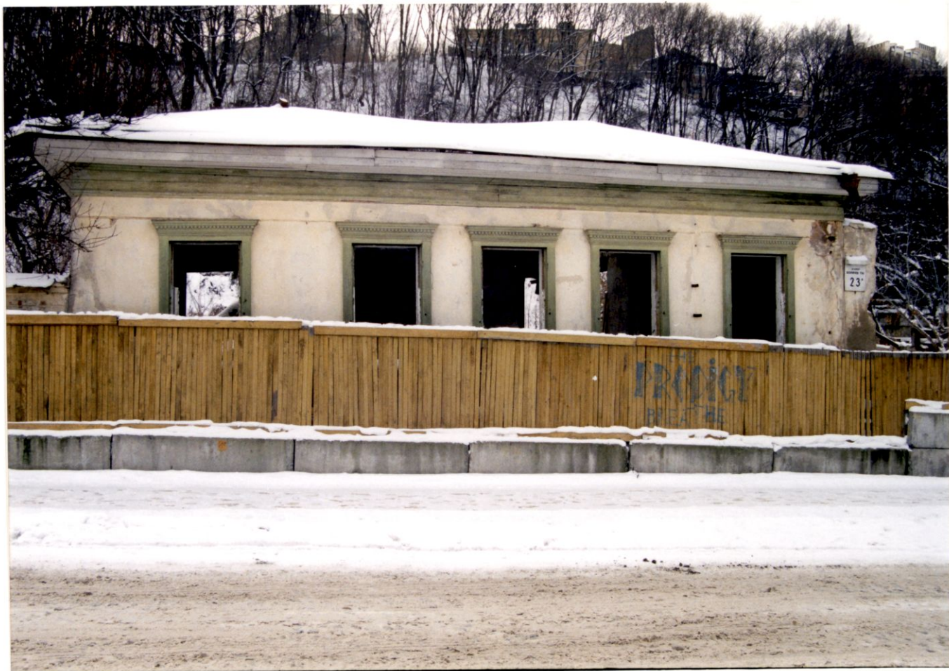
Вул. Беруці в ТСК, 21 Зараньний вурмаг. Фото, 2002р.