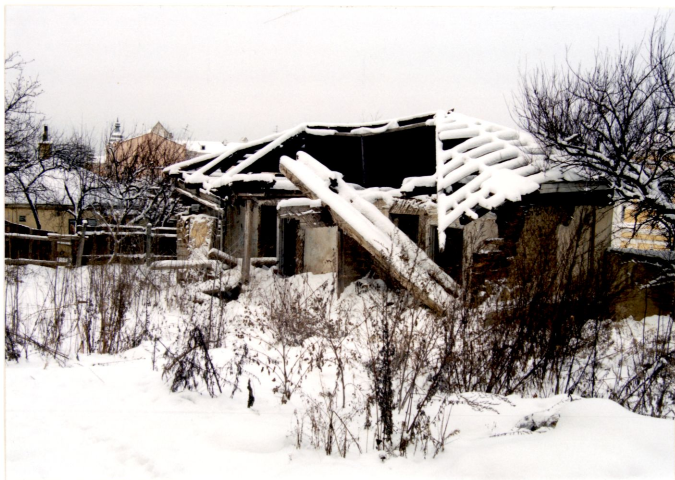
Дворовий фасад Фото 2002р.